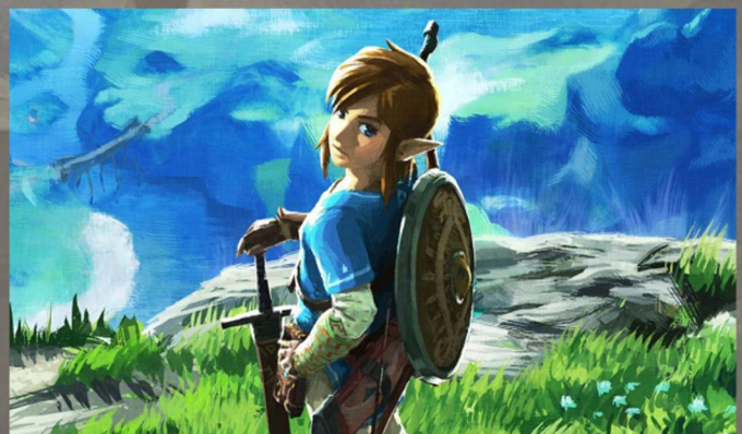
Link, neboli hlavní protagonista The Legend of Zelda: Breath of the Wild.