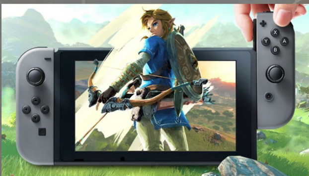
Zelda je jedna z prvních her na novou konzoli Nintendo Switch.